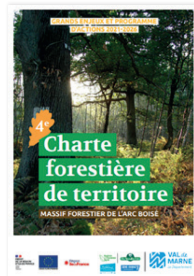
Programme 2021-2026 de la Charte forestière de territoire de l'Arc Boisé

Un guide "Pour une meilleure intégration des lisières dans les documents d'urbanisme de l'Arc boisé", a été réalisé en 2022 par le Cerema Île-de-France dans le cadre de ce projet. Une série d'ateliers collaboratifs visant à faciliter l'appropriation du guide par les acteurs du territoire et notamment par les services d'urbanisme des collectivités ont été réalisés. Il s'agit désormais d'assurer sa diffusion large et de concevoir un plan d'accompagnement "sur mesure" pour le territoire, qui s'appuiera notamment sur ce guide. Une série d'entretiens semi-directifs auprès des élus et des services techniques seront réalisés afin d'évaluer au mieux leurs différentes problématiques et besoins.