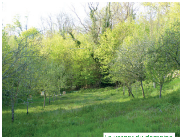
Le verger du domaine