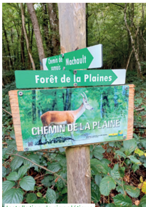
Installation de signalétique en forêt communale

Les panneaux ont été réalisés à l'aide de photographies animalières prises par un photographe du territoire. Les cheminements ont été dotés de noms afin d'aider les riverains à se repérer.