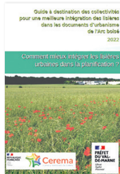
Guide créé par le Cerema Île-de-France dans le cadre de la Charte forestière de territoire de l'Arc Boisé