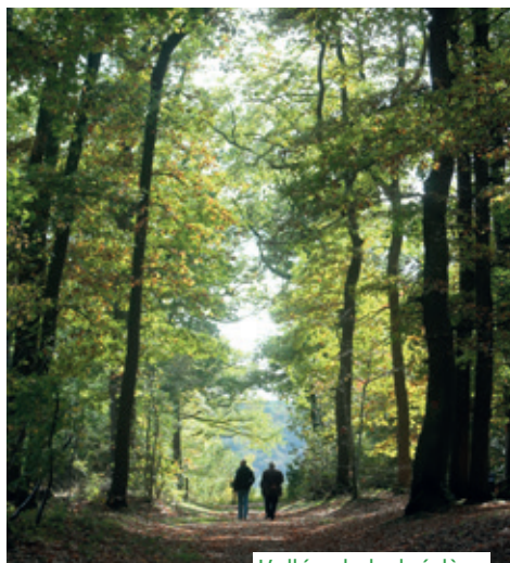
L'allée du belvédère

Face à trois crises majeures (urbanisation, tempête, réchauffement climatique) menaçant le massif forestier du Domaine de Montéclin, le SIAB a souhaité rechercher et expérimenter les meilleures méthodes de la gestion de la forêt en situation de crise.