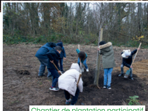
Chantier de plantation participatif

Ce projet présente le partenariat entre RTE, le gestionnaire du réseau public de transport d'électricité haute tension en France métropolitaine, et le Département des Yvelines (signé début 2022 pour 3 ans) dont l'objet principal est de valoriser les espaces sous et aux abords des emprises des lignes électriques traversant des forêts départementales dans le but d'assurer une amélioration de la biodiversité tout en contribuant à l'entretien sécuritaire sous ces emprises. Le projet concerne 6 forêts départementales traversées par des lignes à haute ou moyenne tension, elles sont toutes des Espaces Naturels Sensibles (ENS). Les premiers travaux ont débuté en 2022 et 2023 et se poursuivront en 2024, ils concernent des plantations de haies champêtres, de vergers et de strates arbustives, la création de mares, la coupe de bois pour la mise en place de lisière étagée, ou encore de