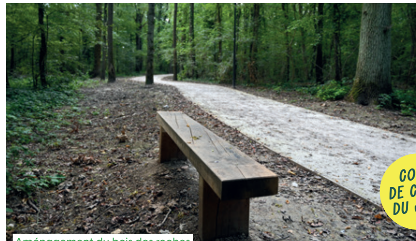
Aménagement du bois des roches