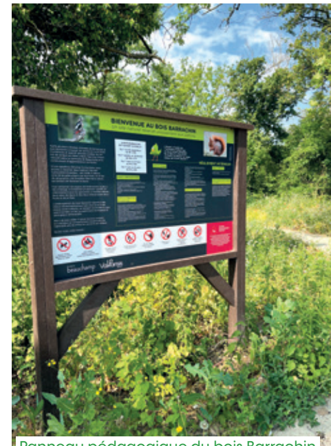
Panneau pédagogique du bois Barrachin

À l'intérieur du bois, deux types de cheminements permettent la circulation : l'un accessible aux personnes à mobilité réduite et l'autre sur un parcours sportif. Des espaces de repos et des panneaux pédagogiques ont été installés pour sensibiliser les habitants à la fragilité et à la richesse écologique des milieux. Un îlot de sénescence d'une surface d'environ 1 ha a été créé pour conserver les arbres dépérissant et préserver la faune liée au bois mort. Des nichoirs ont été posés pour favoriser la présence aviaire.