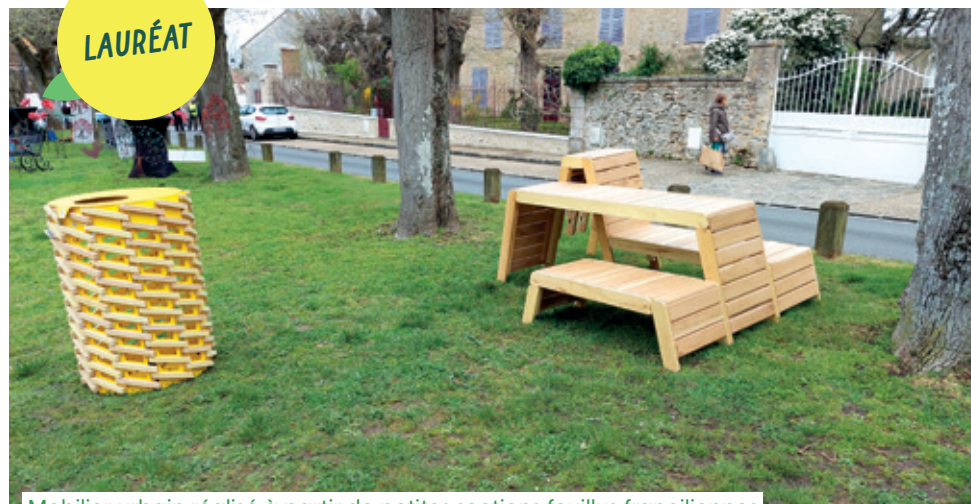
Mobilier urbain réalisé à partir de petites sections feuillues franciliennes

Trilport est une commune de 5 000 habitants située à l'est de Meaux dans le Nord de la Seine-et-Marne. Elle possède un riche patrimoine naturel grâce aux bords de Marne, aux coteaux agricoles et à la présence d'une forêt domaniale de près de 600 ha dont plus de la moitié sur son territoire.