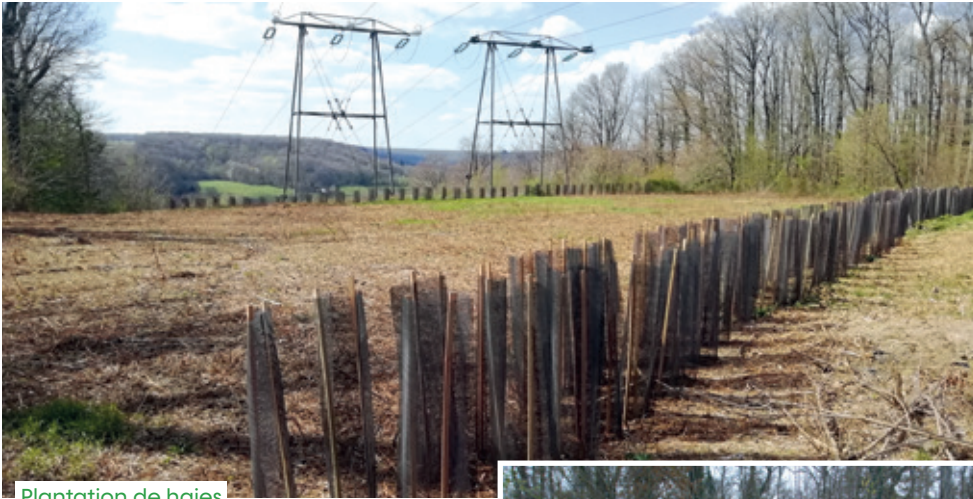
Plantation de haies

Situé à l'ouest de Paris, dans la grande couronne de la Région Île-de-France, le département des Yvelines est composé de 85 % d'espaces naturels et agricoles et offre de ce fait une grande variété de paysages abritant un patrimoine exceptionnel.