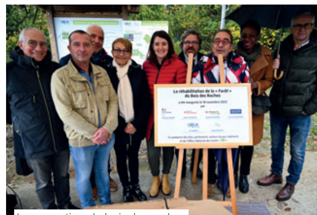
Inauguration du bois des roches

Le projet porté par la commune de Saint-Michel-sur-Orge est une réhabilitation de deux bois de 10 ha situés au cœur de la ville, dans le quartier du Bois des Roches.