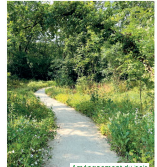
Aménagement du bois

Les aménagements conduits par la CA Val Parisis ont été conçus pour permettre une fréquentation respectueuse de l'environnement floristique et faunistique.